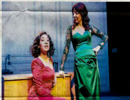
La vida extraordinaria puede verse de jueves a domingo en el Teatro Nacional Cervantes.

Como la vida misma, entonces, la obra transita por todos los matices posibles. Por eso es que Lois y Ve-